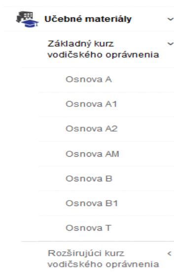
Obr. 1 Učebné materiály v navigačnom menu

Ako inštruktor máte prístup k učebným materiálom a to cez navigačné menu v ľavej časti, položka Učebné materiály.